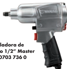
Atornilladora de impacto 1/2" Master Cód. 90703 736 0