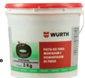
Pasta para montaje de neumáticos Cód. 80893 122