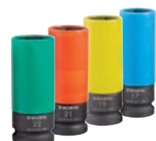
Tubos impacto llanta alum. 1/2" Línea completa.