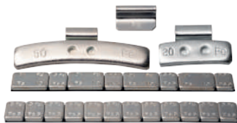
Contrapesos familia completa