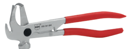
Pinza para contrapesos Cód. 90695 391 885