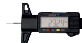
Medidores de desgaste de cubierta Cód. 90715 076 20