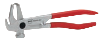
Pinza para contrapesos Cód. 90695 391 885