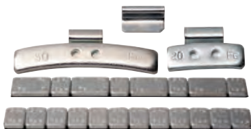
Contrapesos familia completa