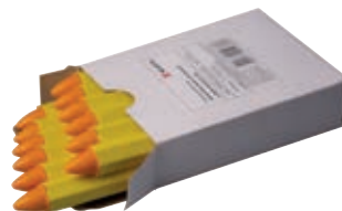
Marcador amarillo de cera Cód. 90984 400 081