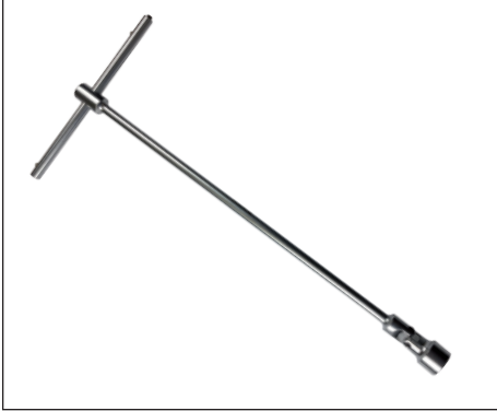
Se convierte en llave T.