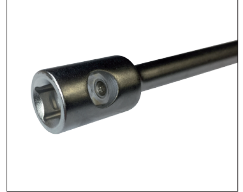
Extremo con orificio pasante y encastre cuadrado de 1/2"