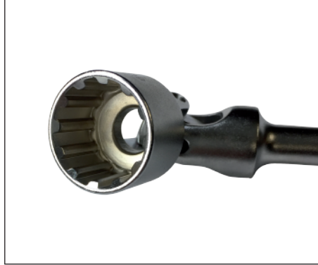
Extremo articulado con encastre multiuso.