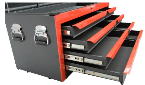
Empuñaduras cromadas, 2 por lateral