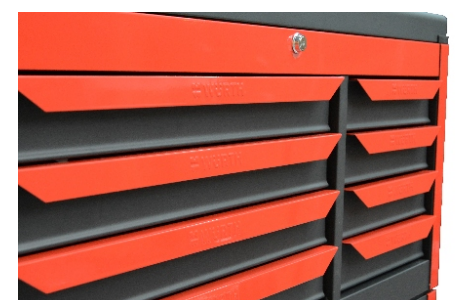
Cierre centralizado y cajones en relieve