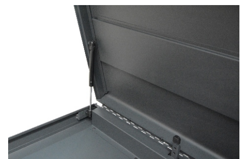
Control de apertura de la tapa superior hidráulico